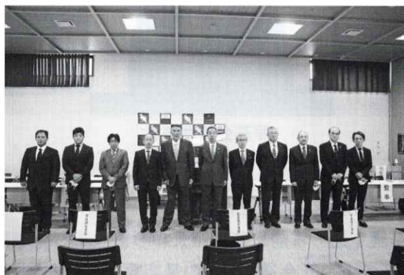
信任された新役員