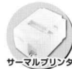
サーマルプリンタ