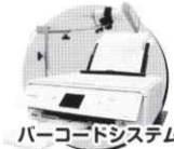
バーコードシステム